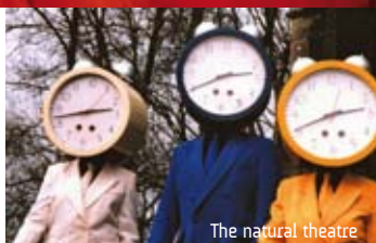
The natural theatre