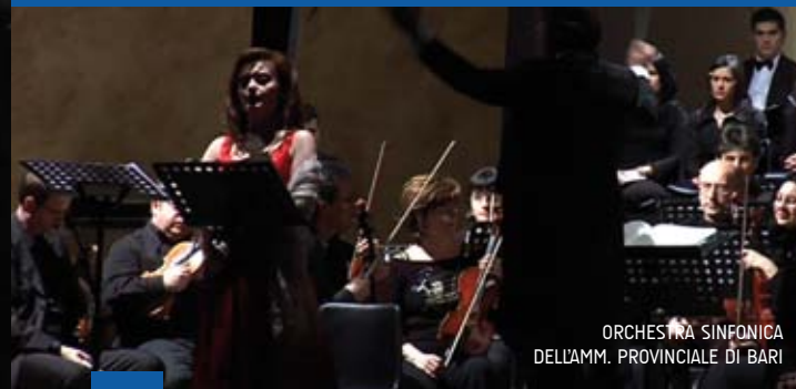
ORCHESTRA SINFONICA DELL'AMM. PROVINCIALE DI BARI