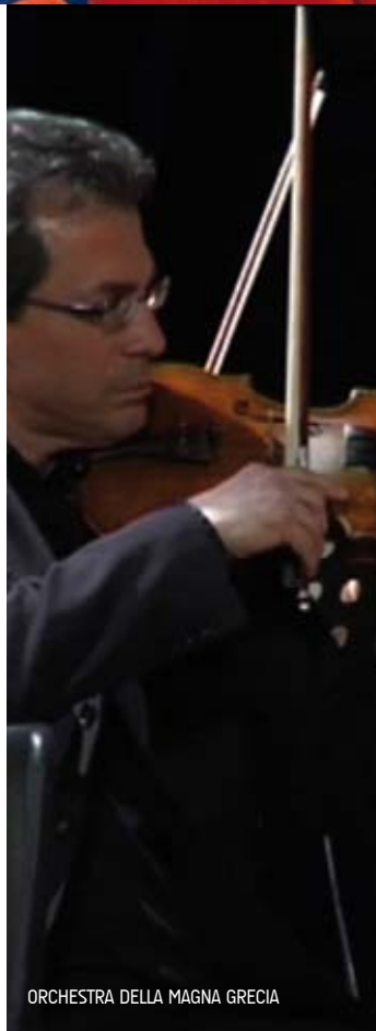
ORCHESTRA DELLA MAGNA GRECIA

Intense overture, syncopated rhythms, opera arias and symphonies characterized the aftermath of Puglia Show Time: a long Easter vacations, celebrated until Tuesday 6th April in 7 towns of Puglia; an event marked by symphonic music and dance.