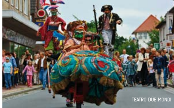
TEATRO DUE MONDI