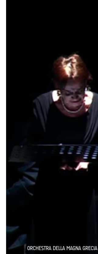
ORCHESTRA DELLA MAGNA GRECIA

For the ending could not miss the meeting event with Slow Food that organized a unique taste workshop in the setting of the Natural Marine Reserve of Torre Guaceto in Brindisi.