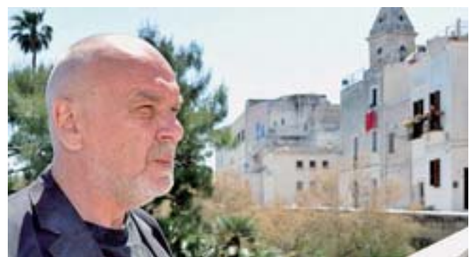
Nekrosius ieri davanti a Santa Scolastica