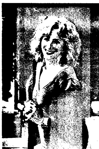
LUNETTA SAVINO Al Margherita