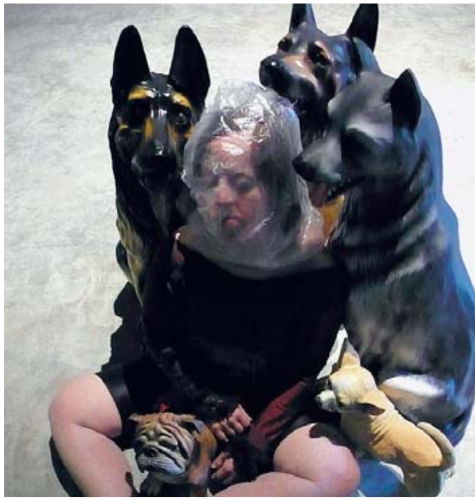
«L'isola dei cani» Uno dei cinque «quadri» che formano il progetto