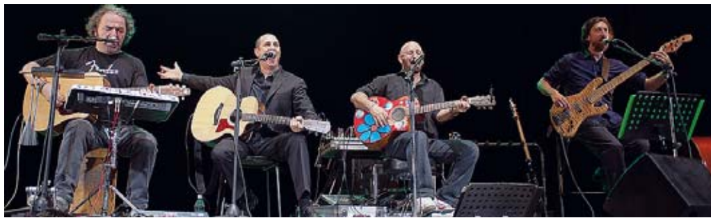
Teatro al Parco Un momento del divertente spettacolo andato in scena sabato sera

II Serata all'insegna del divertimento e dei virtuosismi musicali quella di sabato sera al Teatro al Parco dove, nell'ambito della decima edizione della rassegna ControTempi (co-organizzata dall'assessorato alla Cultura del Comune di Parma, cooperativa Lune Nuove e associazione Controtempi, in collaborazione con la Regione Emilia Romagna e l'associazione culturale Sheherazade), si