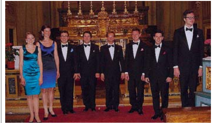
Grandi applausi Il gruppo vocale londinese «Voices8».